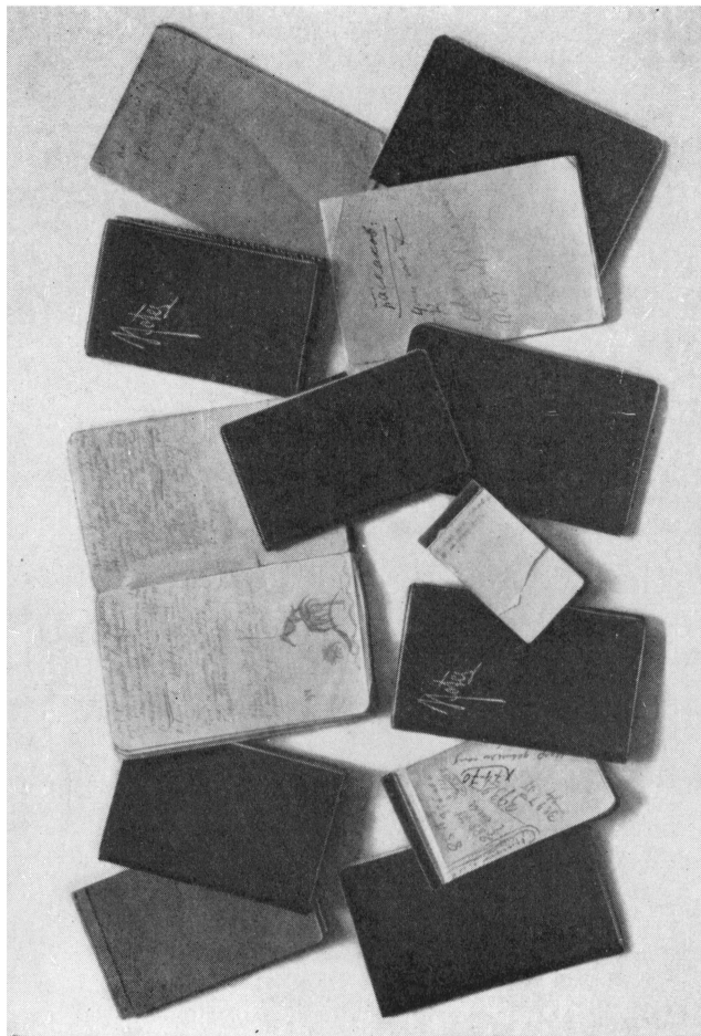
Записные книжки В. Маяковского 1928 года (БММ)