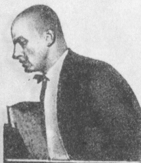
В. Маяковский читает перед микрофоном свое стихотворение.

Вас из забытых и мертвых воскрешает нынче радио!