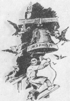
... Бедный, бедный Герцон!

Во все всехсветные пона и песни и лозунг тенет.