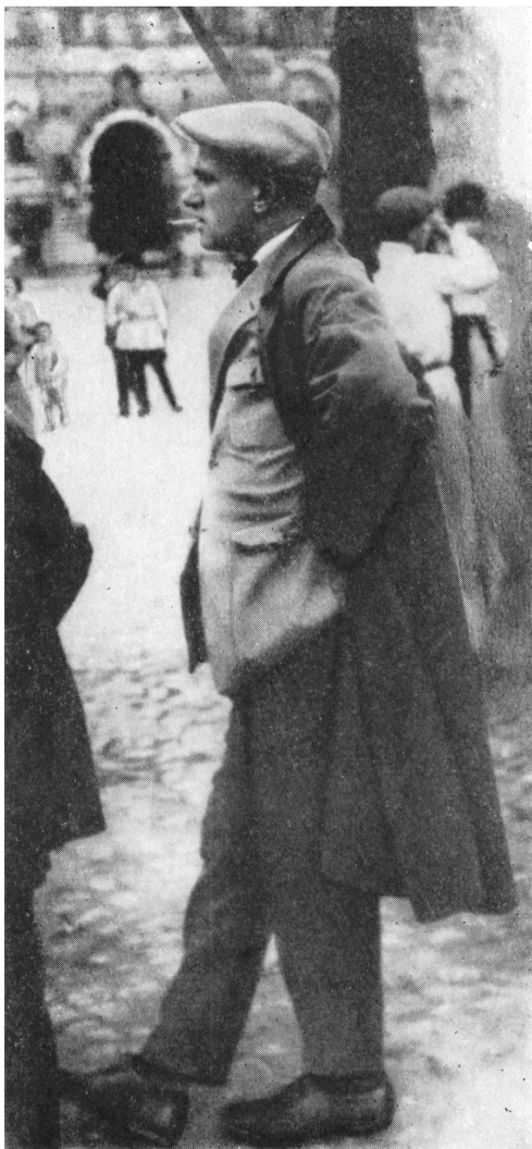
В. Маяковский на Красной площади. Фото. 1928