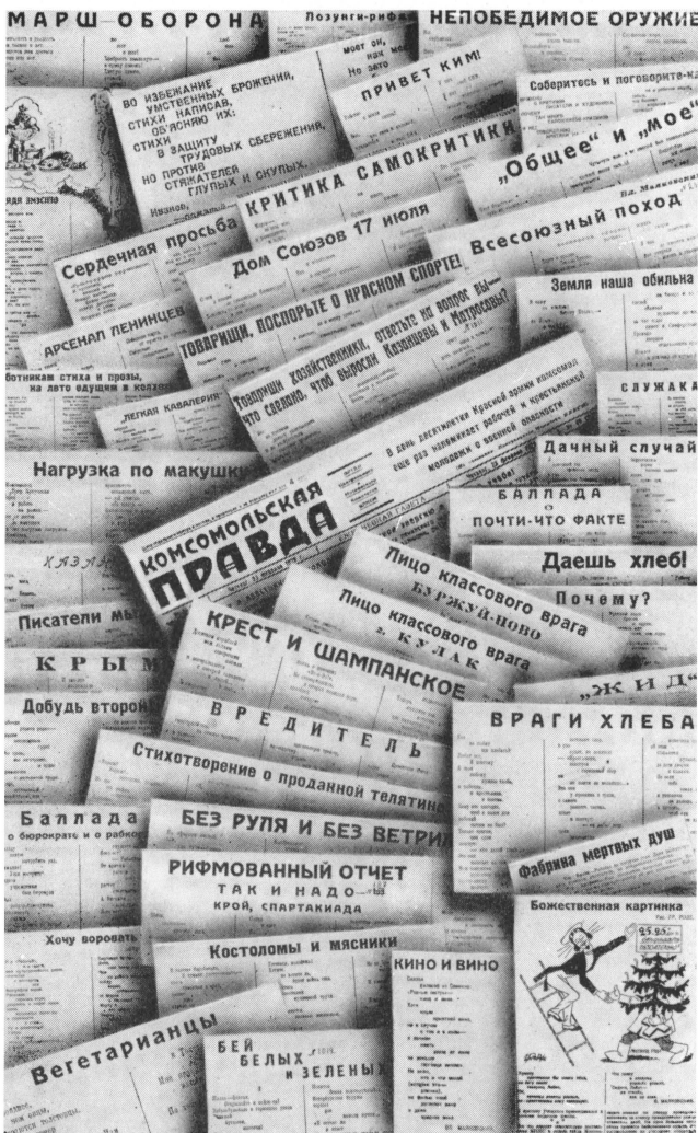
Стихотворения В. Маяковского 1928 года, помещенные в газете «Комсомольская правда». Фотомонтаж.