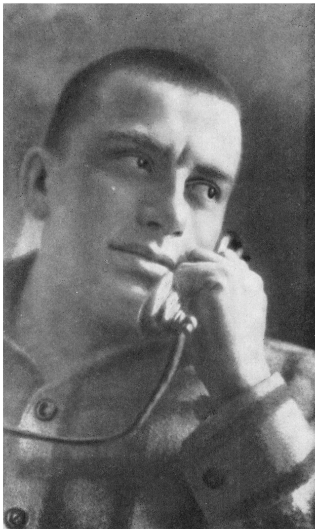
В. МАЯКОВСКИЙ Фото. 1928 г.