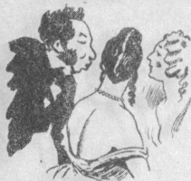
... Бедный, бедный Пушкин!